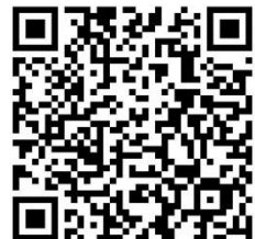
openingstijden zwembad de Fakkel

Voor de openingstijden van het zwembad kun je de QR code scannen met je telefoon.